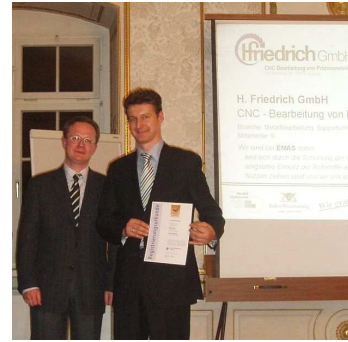
Bilder oben: Anerkennung für die Firmen Mayer Kältetechnik GmbH aus Kupferzell, Adolf Ehardt GmbH (Vaihingen-Riet) und Friedrich GmbH Zerspanungstechnik, Asperg